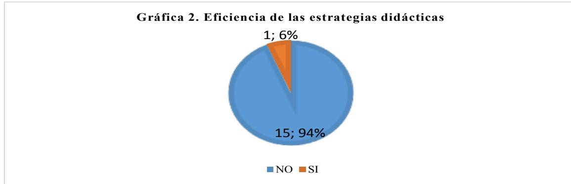
Gráfica 2. Resultados de la eficiencia de las estrategias didácticas