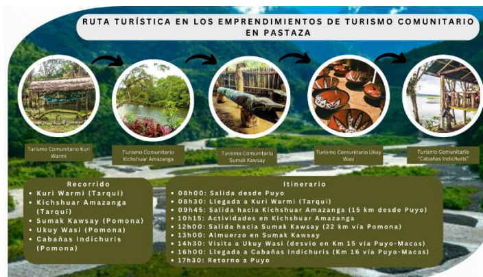
Figura 2: Propuesta del recorrido e itinerario en la ruta turística.

El precio promedio por persona para la ruta turística ajustado según el tiempo de estancia en cada destino y considerando las comidas es de $20.70. Este costo incluye las principales actividades