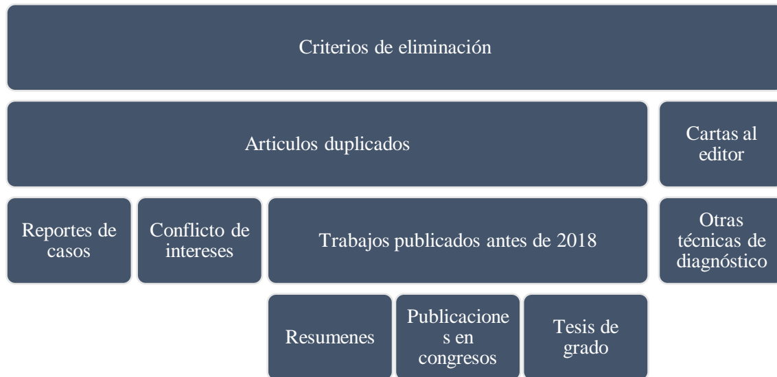
Figura 2. Criterios a usar en el cribado de artículos científicos durante la revisión sistemática.

La recopilación de la información se realizó de manera minuciosa para garantizar la fiabilidad de la extracción de datos, resolver conflictos potenciales a través de la discusión y el consenso de literatura científica. El hallazgo del estudio sobre evidencias y directrices en la punción con aspiración de aguja fina guiada por ecografía en pacientes oncológicos ayudo a presentar los resultados de forma coherente y transparente en el informe de evaluación final de acuerdo con las directrices PRISMA. Este proceso de recopilación de datos basado en PRISMA garantiza la precisión y la transparencia en la recopilación y el informe de datos importantes de estudios incluidos en revisiones sistemáticas integradas.