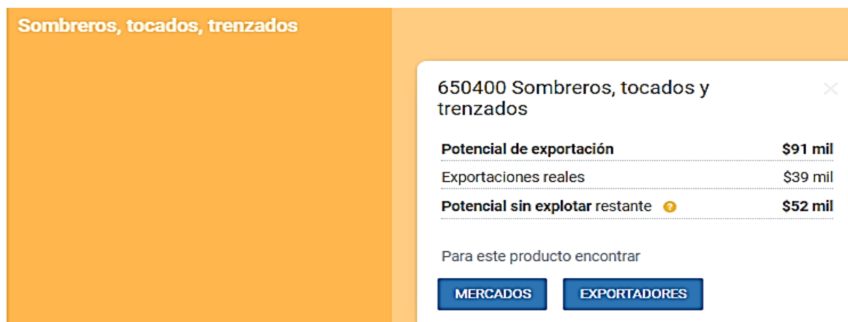
Potencial de exportación para exportar Sombreros, tocados, trenzados hacia Perú.