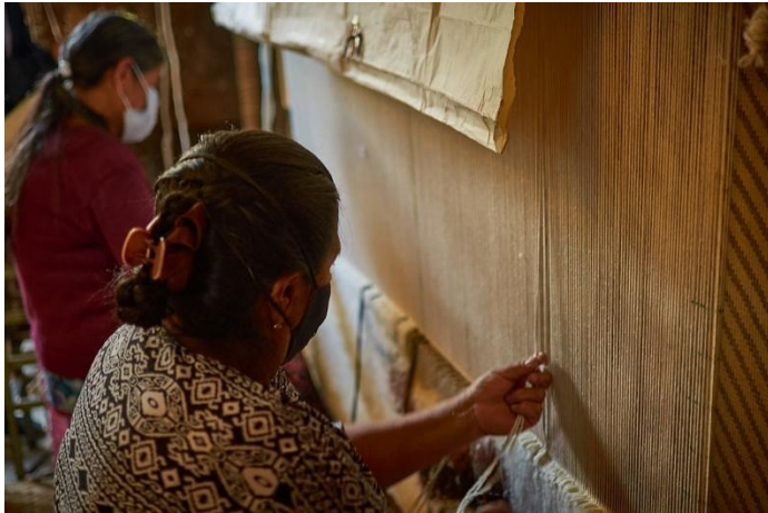
Figura 6. Tejedoras en el telar.

La postura de trabajo en el tejido de las alfombras, según mencionan los artesanos afectan al hígado y los riñones, además la pelusa de la lana y los químicos que se colocan para dar colores, afecta a los pulmones.