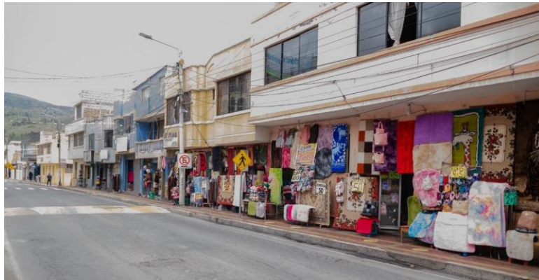
Figura 10. Calle Asunción en la ciudad de Guano. Fotografía de David Layedra, 2020.

En el caso de los artesanos de Guano, se recalca que la técnica para realizar las alfombras a mano, se ha ido perdiendo por adoptar tejidos sintéticos y telares mecánicos que suplen a los antiguos. Estos telares pueden realizar cinco alfombras en un día, en los telares antiguos se puede demorar semanas o meses en la elaboración de una alfombra, dependiendo del tamaño y del diseño que escojan los clientes.