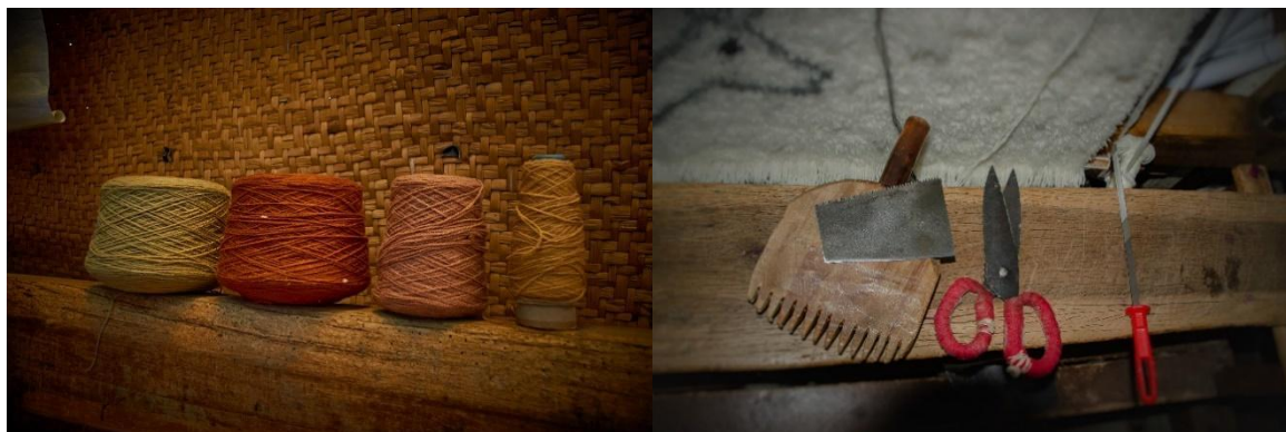
Figuras 7 y 8 . Herramientas para la elaboración de alfombra.

ancho de la alfombra entre todas las urdimbres, a este hilo se lo golpea hasta que se pierda entre los nudos y las urdimbres. El número de nudos varía por el tamaño y finura de la alfombra, lo que puede ser entre 2.000 a 600.000 nudos” (Ficha de Registro PCI, INPC 2019, p. 5)