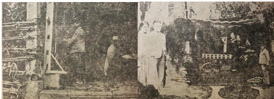
Figuras 4 y 5.

“Los trabajos se realizaban bajo pedido y se comercializaba directamente o a través de intermediarios. La exhibición y venta de alfombras se encontraban en la cabecera cantonal y algunos artesanos colocaban sus talleres en otras ciudades como Quito, Riobamba, o Tulcán [...] En el ámbito internacional las alfombras eran exportadas a Alemania, Francia, Colombia y Estados Unidos” (Ficha de Registro PCI, INPC 2019, p. 3)