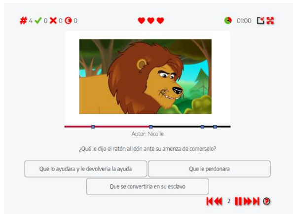
Figura 3. Actividad con un video interactivo

Es una actividad lúdica consistente en la observación y escucha de un cuento en un video interactivo. En determinados puntos de la narración se pausa el video y se hacen preguntas de selección a los estudiantes para comprobar su comprensión y reflexionar acerca de lo aprendido.