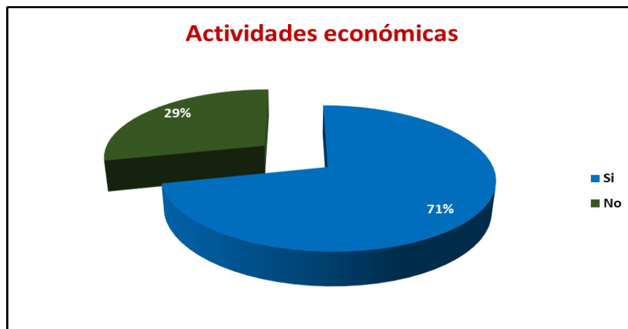
Figura 5. Actividades económicas

Pregunta 24. ¿Considera Ud. que el nuevo régimen contiene facilidades que incentivarán la formalización de las actividades económicas?