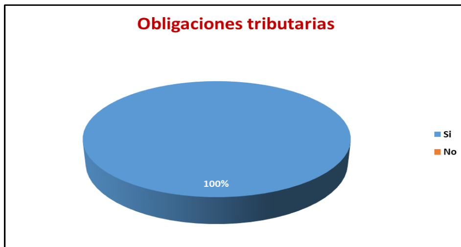
Figura 1. Obligaciones tributarias

Pregunta 1. ¿Tiene Ud. conocimiento acerca de las obligaciones tributarias para el correcto funcionamiento de su microempresa?