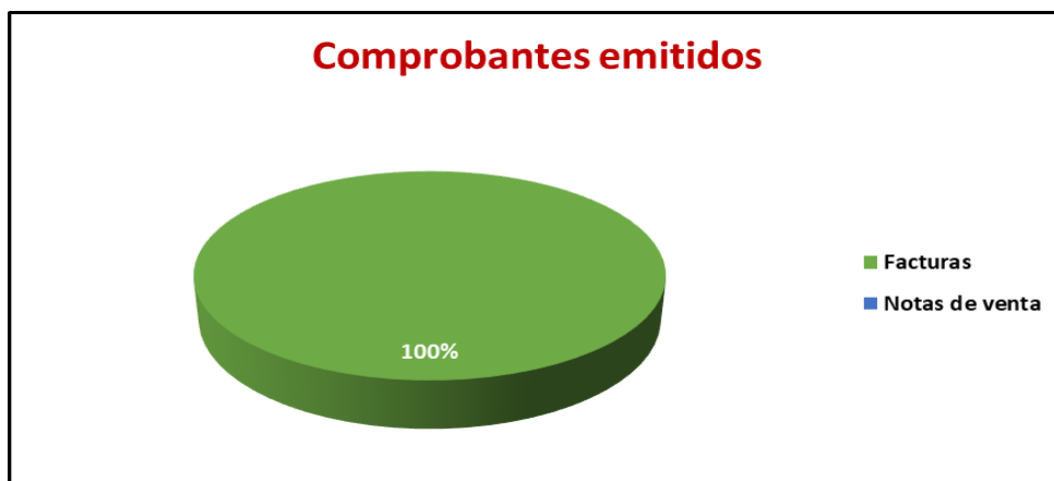
Figura 4. Comprobantes emitidos

Pregunta 13. ¿Cuáles son los comprobantes que usted emite por la venta de su actividad económica?