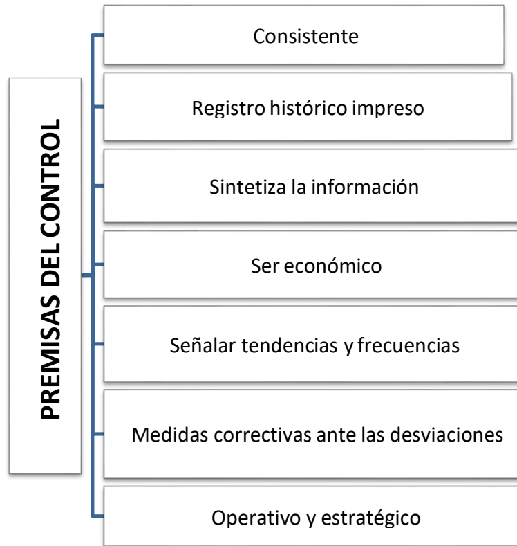
Ilustración 2: Premisas del control