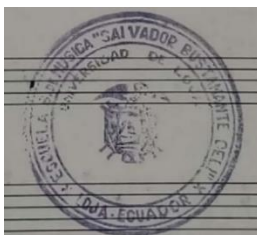
Fig. 2 Sello de la Escuela Superior de Música “Salvador Bustamante Celi” de la Universidad de Loja (1959)