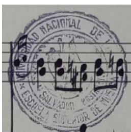
Fig. 3 Sello de la Escuela Superior de Música “Salvador Bustamante Celi” de la Universidad Nacional de Loja. (alrededor de las décadas 1960-1970)

Para el año de 1959, después de varios problemas de denominación y administración, la institución pasa a llamarse Conservatorio Salvador Bustamante Celi de la Universidad de Loja. Sin embargo, esta situación cambia en el año 1971 que, por decreto presidencial, se clausuran las universidades y surge la completa separación del Conservatorio con la Universidad Nacional de Loja. Estos cambios implicaron también movilizaciones a diferentes edificios de la ciudad y naturalmente el desplazamiento de los materiales de trabajo, muchos de los que ahora constituyen el archivo del conservatorio.