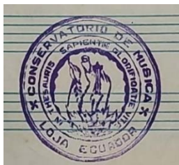
Fig. 1 Sello del Conservatorio de Música de la Universidad de Loja (1944-1959)