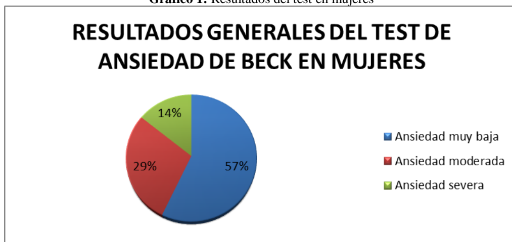
Grafico 1: Resultados del test en mujeres

Análisis: Luego de la aplicación del test beck, se muestran los resultados en el grafico 1, se determina que el 50% de los hombres encuestados presentan un nivel de ansiedad muy bajo, por otro lado un 35% obtuvo como resultado un nivel de ansiedad severa, el restante 15% revelan ansiedad moderada.