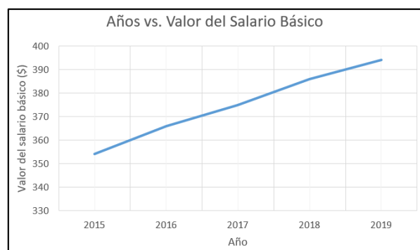
Ilustración 2. Aumento del valor del salario básico con el paso del tiempo.

Los cálculos de correlación de Pearson serán obtenidos a través del programa SPSS y después de realizar un respectivo análisis se podrá dictaminar una opinión sobre dicha relación.