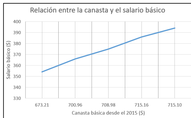
Ilustración 3. Relación entre la canasta y el salario básico.

Por último, se muestra la relación directa que existe entre la canasta y el salario básico.