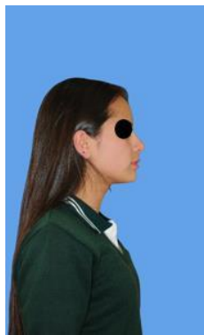
Gráfico 1. Fotografía Preliminar

Paciente de pie, de perfil con una posición natural de la cabeza la cual se obtuvo con el paciente relajado, de pie, piernas ligeramente separadas, los brazos al costado del cuerpo con sus labios en reposo y dientes en oclusión, cabello recogido y por detrás de la oreja y sin objetos en su rostro.