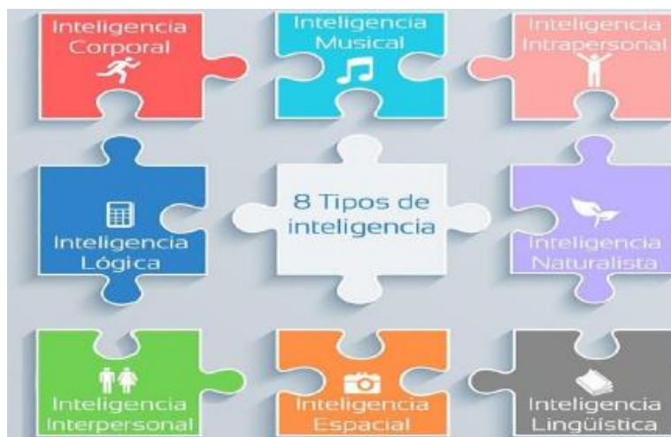
Figura 3: Inteligencias múltiples

En cambio, para Del Toro, (2012) la inteligencia trata más bien de la capacidad del individuo para resolver problemas o situaciones, así como su destreza para crear productos en un amplio contexto. Este investigador plantea que cada persona tiene habilidades para desarrollar varias capacidades, como también las tiene para recibir conocimiento, asimilarlo, elaborar información que en ocasiones se convierte en un producto, pues la aplicación de este conocimiento le permite resolver problemas que se le presentan; además considera que cada persona tiene su propio coeficiente intelectual.