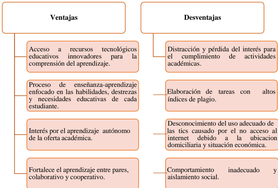
Figura 2: Ventajas y desventajas de las TIC desde la perspectiva estudiantil.

El estilo de vida de los niños y adolescentes se desarrolla en una sociedad apoyada en la globalización interconectada dando como resultado que las TIC son parte del diario vivir y del crecimiento, pues, las tecnologías de la información y comunicación son cada vez más predominante entre los jóvenes de la era actual.