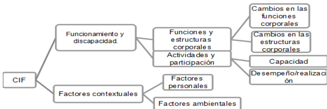
Gráfico N.º 1

La CIF, establece un modelo exhaustivo sobre el funcionamiento, discapacidad, salud; y, que constan de tres parámetros: el primero las funciones fisiológicas/psicológicas y elementos anatómicos que es la ausencia o alteración en funciones y estructuras. El segundo la actividad, que se enmarca a las limitaciones de realizar actividades de una persona. El tercero la participación en situaciones sociales que se constituyen en una restricción. ¡Error! No se encuentra el origen de la referencia.. Así como su nueva clasificación en cuanto al tema que nos atañe Egea García & Sarabia Sánchez