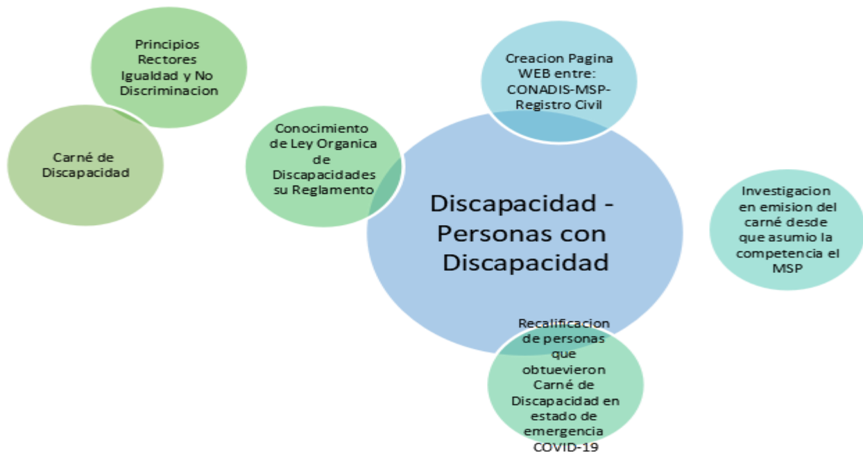
Gráfico N. 3