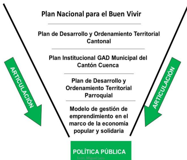
Figura 5. Herramientas Técnicas de Planificación