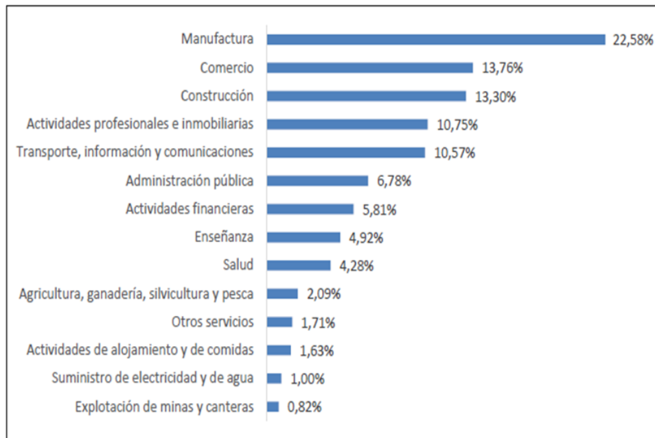
Figura 1. Valor agregado bruto por rama de actividad