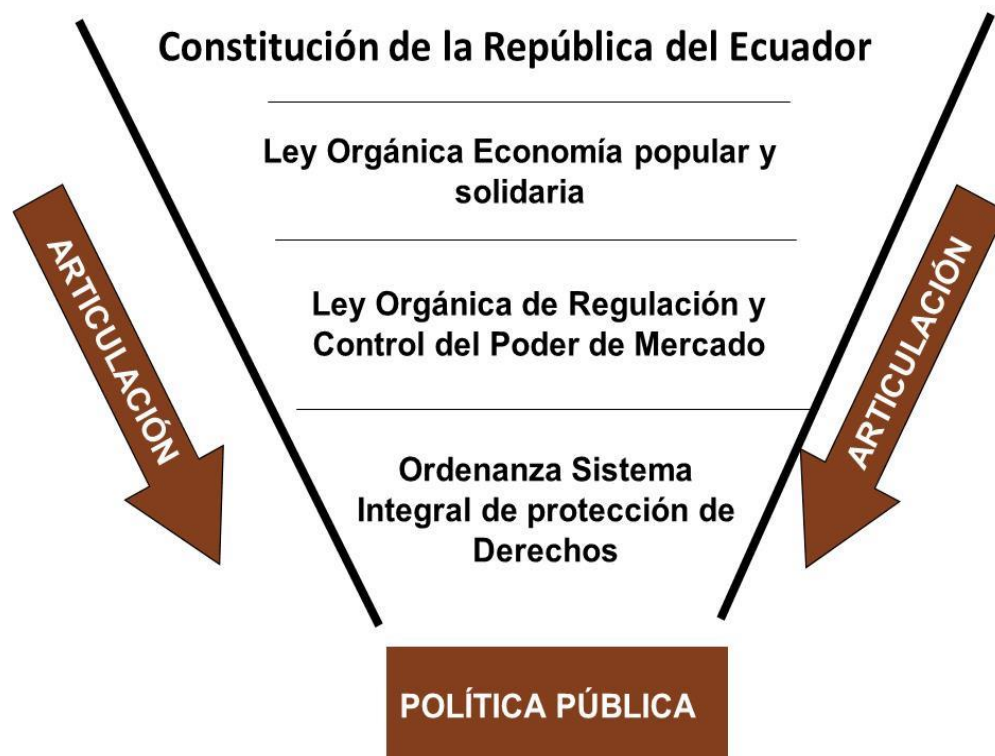
Figura 2. Marco legal del emprendimiento