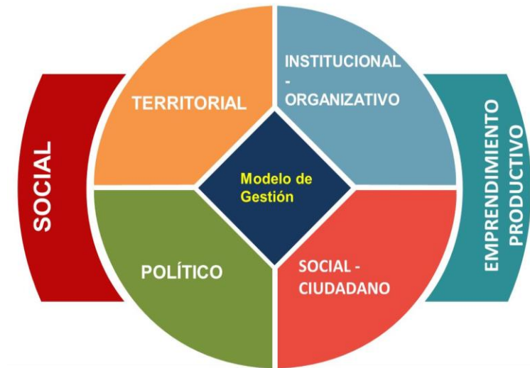
Figura 3. Ámbito de intervención