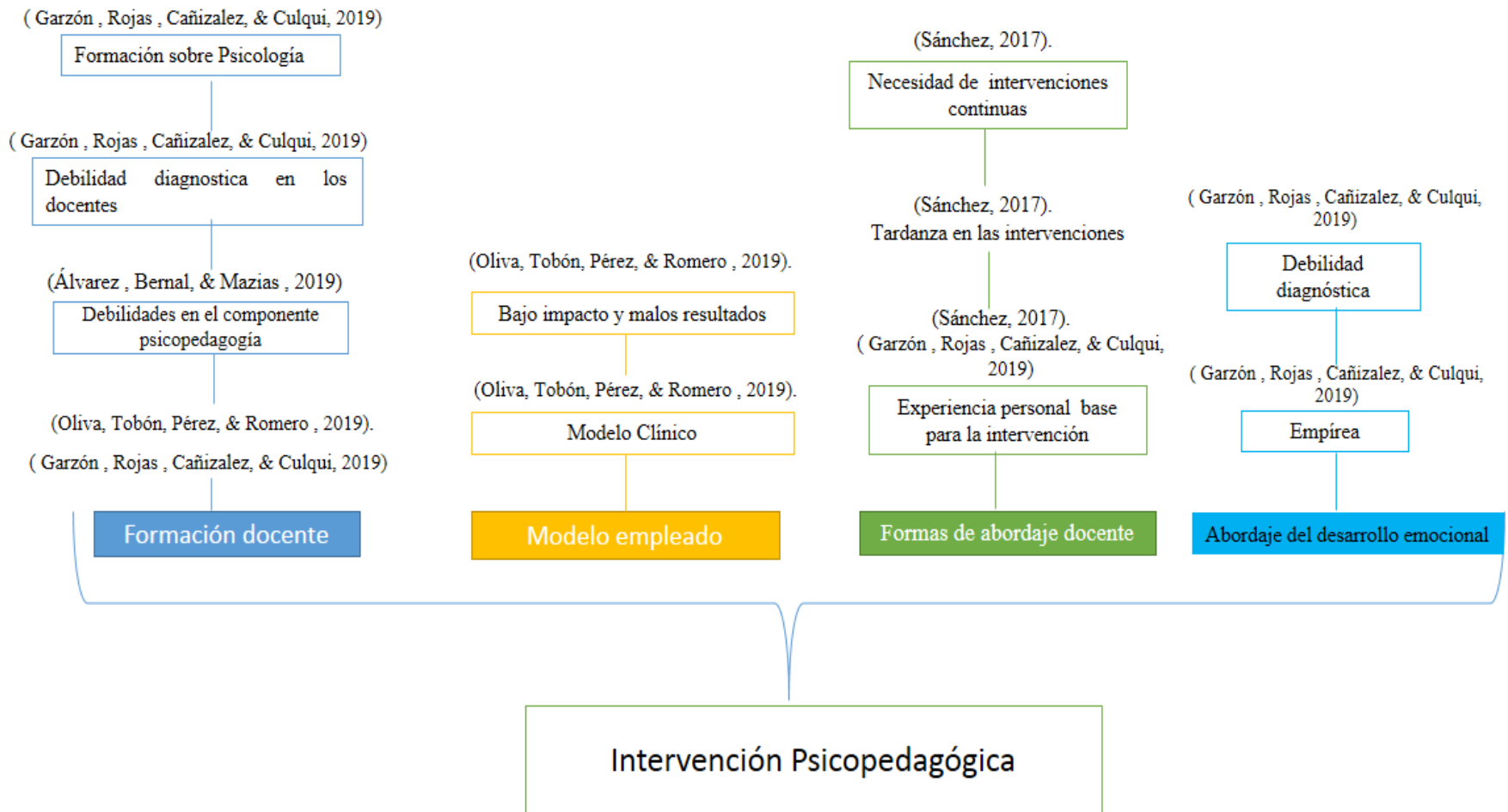
Ilustración 2 Matriz de categorías sobre intervención psicopedagógica en el desarrollo emocional