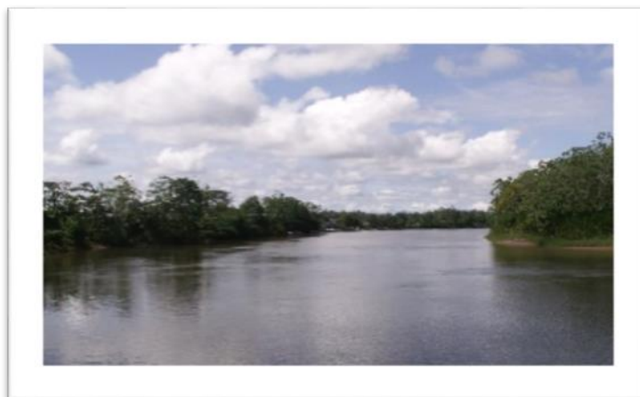
Foto N.- 1 Vista al Río Payamino